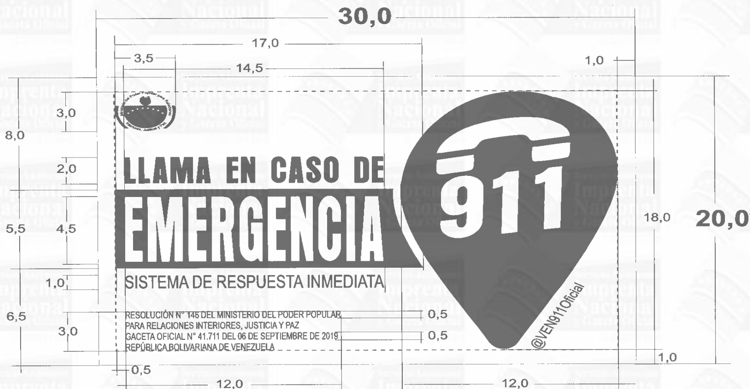
30x20 AVISO AUTOADHESIVO USO TRANSPORTE PUBLICO